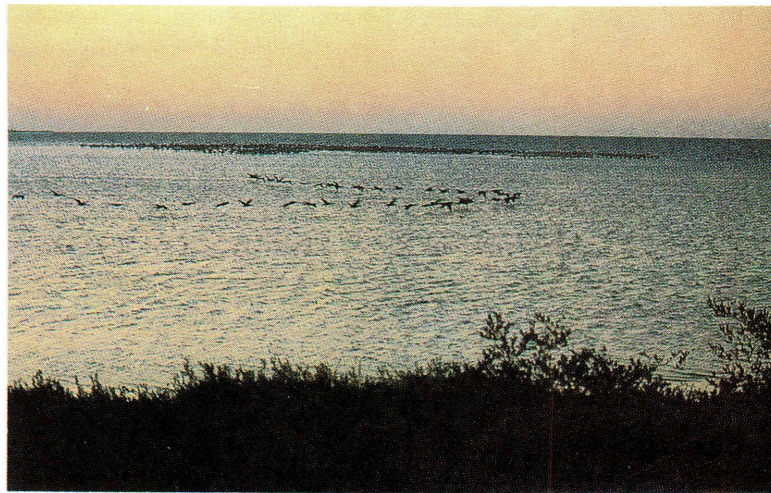
Santuario de flora y fauna Los Flamencos.

En resumen, la posesión de recursos energéticos relevantes en lo hemisférico y de invaluable reservas ambientales en lo internacional le otorga al país una opción fecunda para convertirlo en un actor con un estatus gravitante en el terreno regional y con una proyección interesante en la escena mundial. Pero para que estos dos propósitos se consoliden, Colombia requerirá, adicionalmente, una capacidad científico-tecnológica endógena y fuerte, necesaria para garantizar la continuidad de su estatus, y un ordenamiento interno más equitativo y equilibrado en lo económico y político, factores sin los cuales no podrá asegurar la estabilidad y el desarrollo indispensables para trasladar al frente externo su mayor potencial recursivo. ●