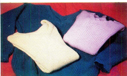
Algunos campos de aplicación en Colombia