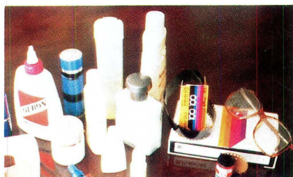
Algunos campos de aplicación en Colombia