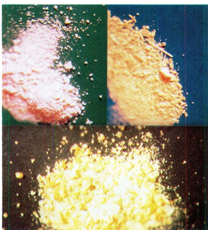
Alcoholes polivinílicos no refinados